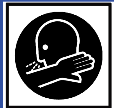
In die Armeuge niesen