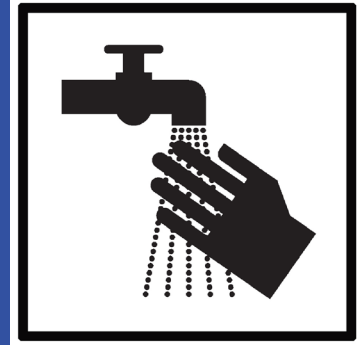
regelmäßig Hände waschen