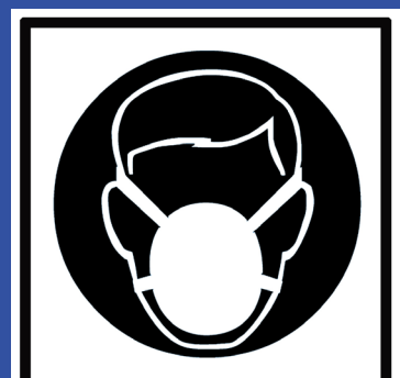
Mund/ Nasenschutz tragen