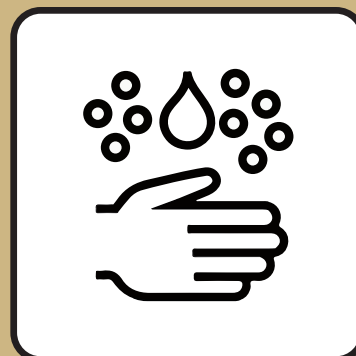
Hande waschen oder desinfizieren