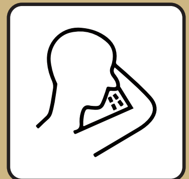
In die Armbeuge niesen und husten