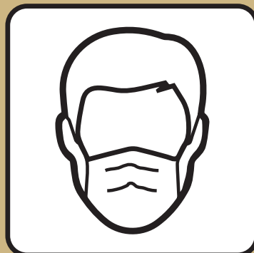
med. Mund-/Nasenschutz tragen