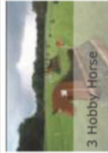
3 Hobby Horse