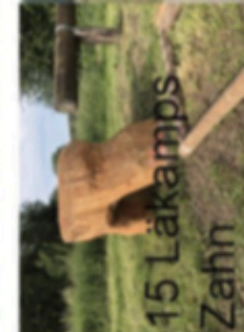
15 Lakamps Zahn