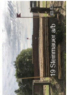
19 Steinmauer abt