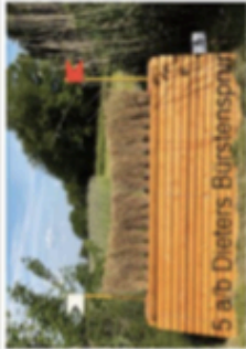
5 a/b Dieters Burgstonsprung