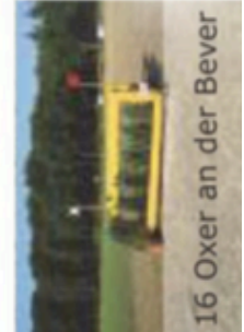
16 Oxer an der Bever