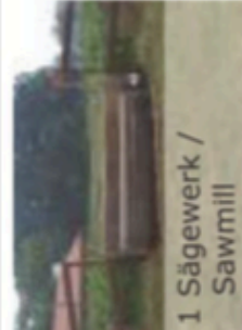
1 Sägewerk / Sawmill

PDA PLANUNGSGRUPPE DÖRENKÄMPER + AHLING PDA Planungsgruppe Dörenkämpfer + Ahling GmbH & Co. KG Hauptstraße 108 • 48346 Ostbevern Tel.: (02532) 95 601-00 Fax: (02532) 95 601-29 www.pda-planungsgruppe.de