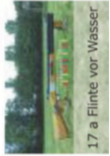
17 a Flinte vor Wasser