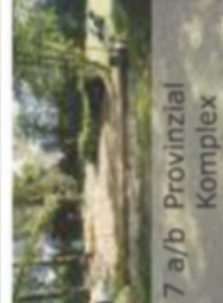
7 a/b Provinzial Komplex