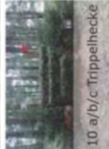
10 a/b/c Trippelhecke