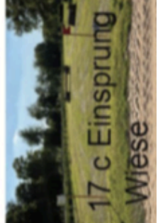
17 c Einsprung Wiese