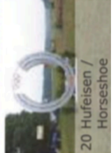
20 Hufeisen / Horseshoe