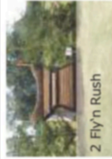
2 Fly'n Rush