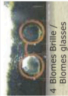
4 Blomes Brille / Blomes glasses