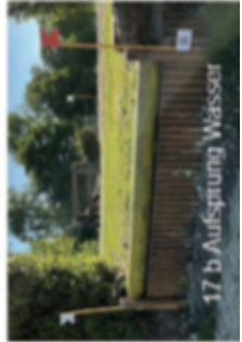
17 b Aufsprung Wasser