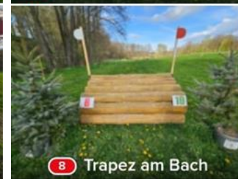
8 Trapez am Bach