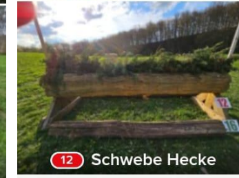
12 Schweben Hecke