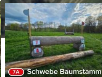
7A Schweben Baumstamm