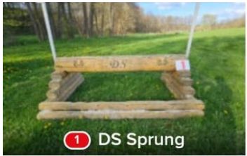
1 DS Sprung