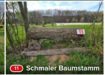
11 Schmalen Baumstamm