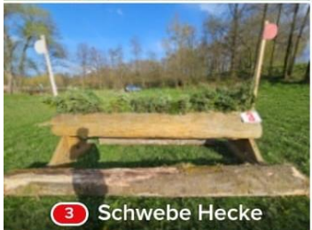
3 Schweben Hecke