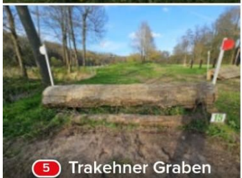
5 Trakehner Graben