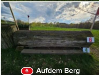
6 Aufdem Berg