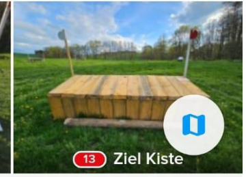
13 Ziel Kiste