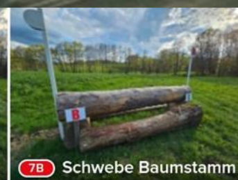
7B Schweben Baumstamm