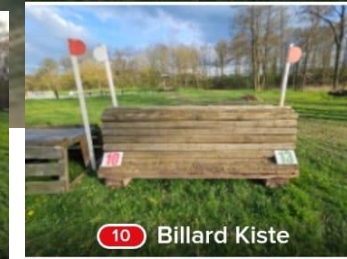
10 Billard Kiste